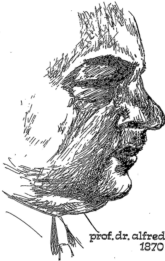
prof. dr. alfred adler 1870 - 1937